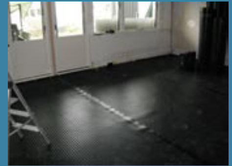
Black Line är utlagd och luftnedsläpp monterade.