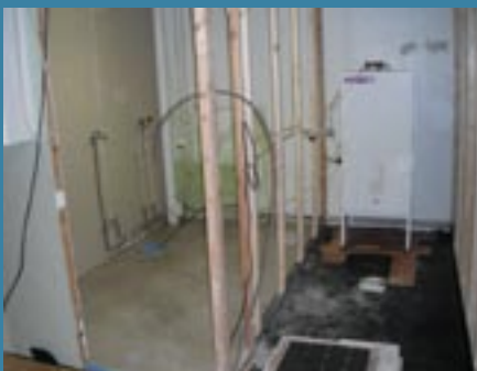
Golvbrunn är utbytt och ovan Opti Vent systemet spacklades ytan, fuktsäkrades och belades med klinker.