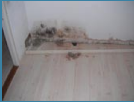
Bilden är tagen där garderob stod mot yttervägg i barnrum, innan arbetet sattes igång.