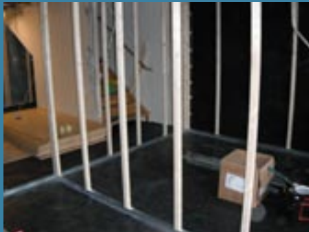
Regelstommar monterades ovan Opti Vent, skivor monterades i egen regi, så även övergolv ovan Opti Vent.