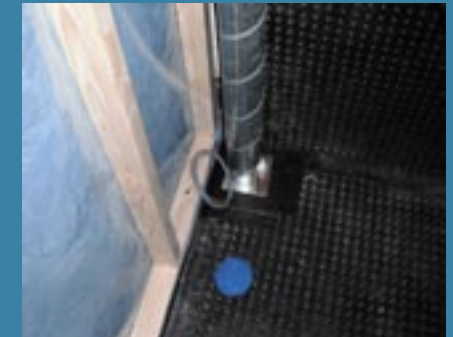
Utvändig fläkt är monterad för att minska ljudet i boytan, bilden visar sugpunkten.

Det är mycket viktigt att filtren i filterdonen, dammsugs minst var fjortonde dag. Byte av filter bör ske med 12 - 24 månaders mellanrum.