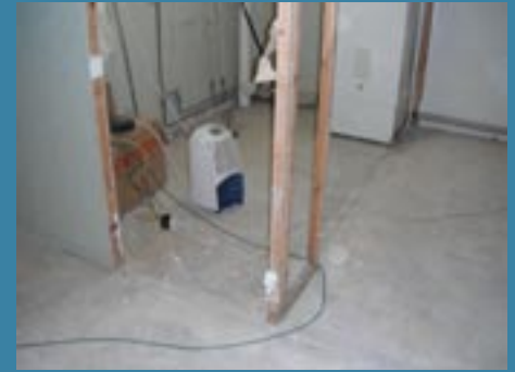
På alla golv och ytterväggar under mark, har beställaren i egen regi rengjort ytan för att uppnå bästa resultat.