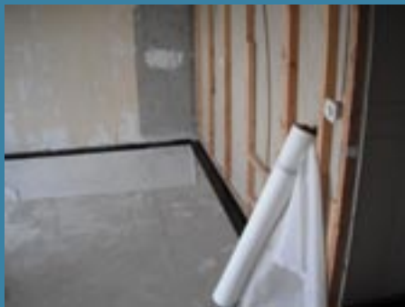
Fiberduk monterades för att undvika klapperljud.