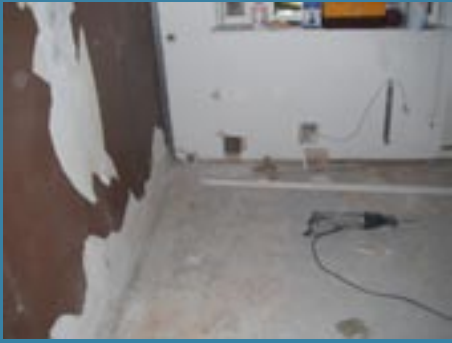
Innan installation av Opti Vent systemet utfördes, gjordes kontroll och genomgång för att fastställa rätt utförande, även syll mot baksidan mättes.